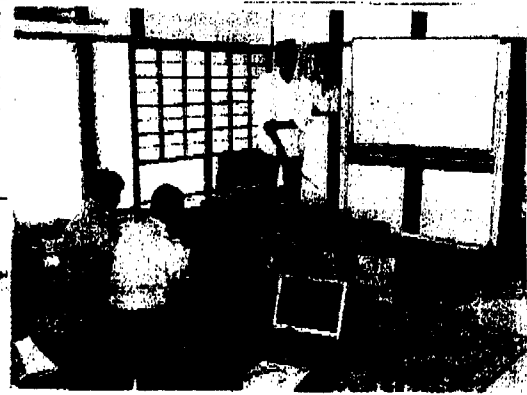
参加者が、森林の再生や地域づくりについて訴え、相互連携の強化を確認した。

里山をかした暮らしを、地域づくりを通じて実現したい。参加者は、森林の再生や地域づくりについて訴え、相互連携の強化を確認した。